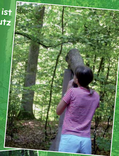
Wald ist Schutz