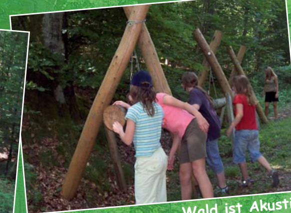
Wald ist Akustik