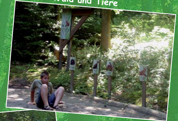
Wald und Tiere