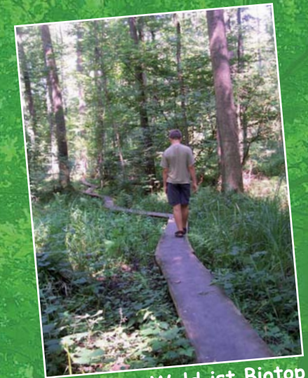
Wald ist Biotop