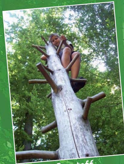
Wald ist Baustoff

Der Eppinger Waldfühlpfad beginnt und endet am Jägersee zwischen Eppingen und Kleingartach. Die Anfahrt zum Jägersee ist ab der Landstraße L1110 Eppingen nach Kleingartach ausgeschildert. Der Waldfühlpfad verläuft überwiegend auf unbefestigten Naturwegen.