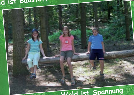
Wald ist Spannung