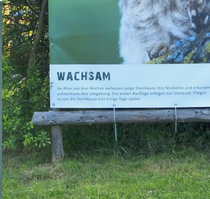
Theater Fräulein Brehms Tierleben Canis Lupus